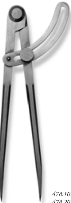
478.101 / 478.201