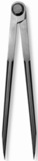
475.101 / 475.201