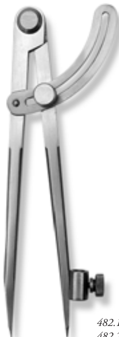
482.101 / 482.201